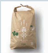
[2019] KOMINO RICE [PACKAGE] CL 山南営農組合