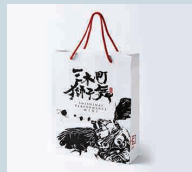
[2019] Miki Town SHISHIMAI PUT [四十四 Brand] CL 三木町役場