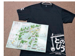
自らデザインした、ハイキングガイド用Tシャツ。モンベルと土庄町のコラボ仕様。去年のコロナ禍に作成した皇踏山ハイキングマップ。少しでも多くの方に皇踏山の素晴らしさを知ってもらおうと作成。

当日、予報通り小雨からのスタート。途中から雨脚も強くなり、コース変更を余儀なくされました。しかし、事前の雨対策と参加者のチームワーク、そして雨のハイキングを楽しむという姿勢にも助けられ、無事に終了することができました。最後に参加者の方から「楽しかった！ぜひ、また参加したい！」とのお声をいただき、ホッとしたりと同時に、また喜んでもらえるようなツアーを行いたいと心から思いました。