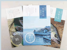
「かがわ里海の幸」冊子撮影、デザイン CL 香川県庁