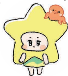
直島町地域おこし協力隊パートナー セキララ☆ちゃん