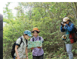
広告や情報発信用のイメージ写真撮影。(撮影者:小豆島カメラ坊野さん)。撮影場所の選定や衣装準備は自ら行う。

今現在、具体的なことは決まっていますが、今まで行ってきた活動を引き続き行えるように地固めをしているところです。それと共にデザインに関わる仕事も並行して行っていきたいと考えています。