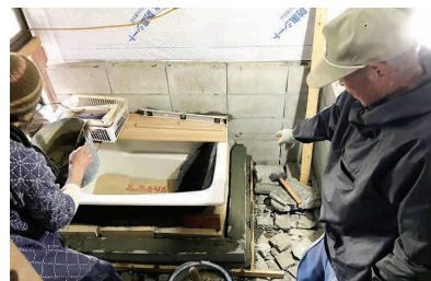
田んぼに囲まれた民家で、薪風呂体験ができる場所。暮らしに近い交流スペースとして開放し、町内外からお茶会やイベントで利用されている。

たおじいさんが毎日作業場に足を運び、完成後もはりきって薪割りをしたそうです。新聞に取り上げてもらうことで、おじいさんの知り合いがお風呂に入りたくて訪ねてきたりしました。