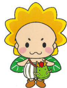
まんのう町公式マスコットキャラクター まんテンちゃん